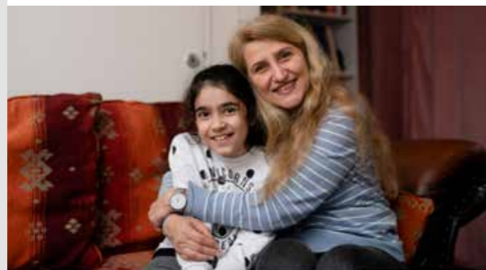
Twee jaar lang 'gewoon geld' voor gezinnen in Amsterdam. kansfonds.nl · Leestijd: 2 min.

#gewoongeldgeven #Amsterdam #armoede #bestaanszekerheid