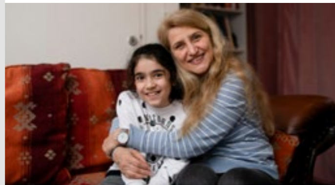
Twee jaar lang 'gewoon geld' voor gezinnen in Amsterdam kansfonds.nl - Leestijd: 2 min.

#gewoongeldgeven #Amsterdam #armoede #bestaanszekerheid